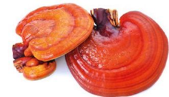
Reishi Ganoderma lucidum

dsf Dipartimento di Scienze del Farmaco dell'Università degli Studi di Padova