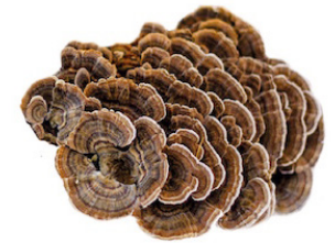
Trametes Trametes versicolor