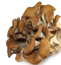
Maitake Grifola frondosa